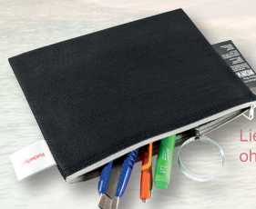
Lieferung ohne Deko