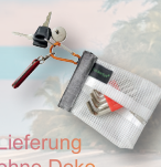
Lieferung ohne Deko